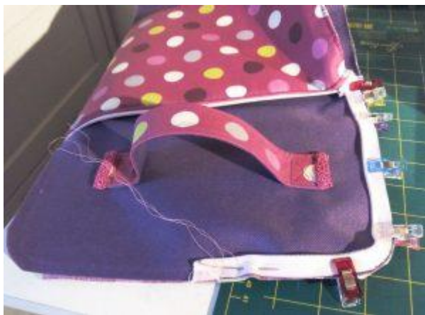
Poser le 2ème côté du zip sur le tissu extérieur

6 - Fixer la 2ème partie de la fermeture éclair au couvercle : il faut positionner la doublure/isolant contre le tissu extérieur envers contre envers. Poser le côté endroit du zip contre l'endroit du tissu extérieur. Couper les angles du tissu extérieur en arrondi, cranter le zip dans les angles, et faufiler pour faciliter la couture. Piquer à la machine avec le pied spécial fermeture éclair.