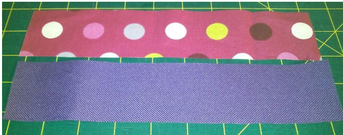
Bandes de tissu pour la poignée

5 - Poignée : assembler endroit contre endroit les deux bandes de tissu de 24 cm x 5 cm, épingler, coudre sur trois côtés et laisser un des petits côtés ouvert pour pouvoir retourner. Retourner sur l'endroit, faire un rentré sur le côté laissé ouvert et le fermer lors de la surpiqûre finale à effectuer sur tout le pourtour. Positionner la bande sur la partie "couvercle" en veillant à bien la centrer dans la largeur. Fixer chaque extrémité de la bande en faisant une couture en forme de croix.