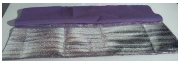
Le zip est pris en sandwich entre les 2 tissus