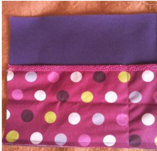
Poche cousue avec son galon décoratif

3 – Fermeture éclair : Prendre le zip et coudre à environ 4 cm de chacune des deux extrémités les petites bandes de tissu de 8 cm x 3 cm. Il faut les placer endroit du tissu contre endroit du zip, coudre sur la largeur, rabattre et couper ce qui dépasse. Le trait vertical correspond à la couture à faire.