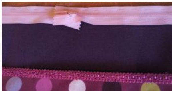
Faufiler le zip sur le tissu extérieur

4 - Poser le premier côté de la fermeture éclair de 60 cm (ou les 2 de 30 cm) tout le long du rectangle correspondant au tissu extérieur de 20 x 60 cm, l'épingler, le faufiler puis piquer à la machine en utilisant le pied spécial zip. Assembler ensuite la doublure/isolant sur la fermeture éclair. Celle-ci se trouve donc prise en sandwich entre les deux tissus. Piquer, rabattre envers contre envers et surpiquer.