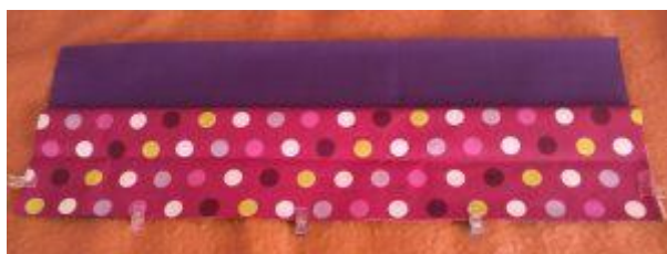
Assemblage pièces de la poche

2 - Poche extérieure : plier en deux le rectangle de tissu de 24 x 60 cm (ici coton enduit à pois), on obtient un rectangle de 12 x 60 cm. Coudre le galon sur la partie supérieure du tissu dédié à la poche. Épingler la poche sur le tissu extérieur, coudre la partie inférieure et faire trois coutures verticales pour avoir 3 poches séparées. Ici, il y a une séparation sur chaque côté. La 1ère couture verticale est à 18cm du bord, la 2ème fait toute la largeur de la face avant, soit 24 cm, et la dernière correspond au 2ème côté, et mesure donc 18 cm.