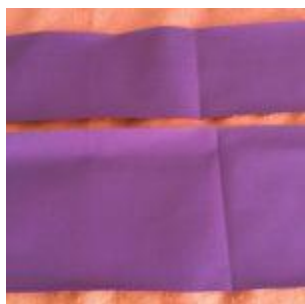
Tissu extérieur - Toile à sac