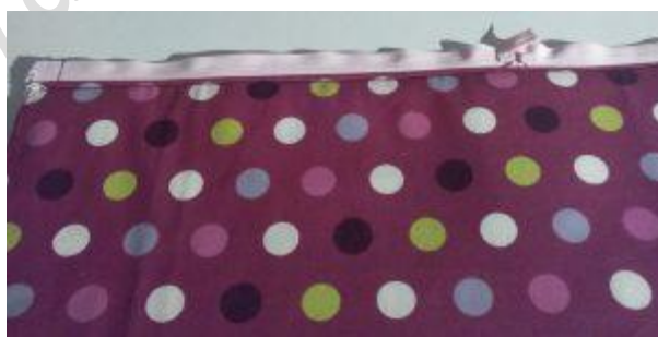
Vue zip, côté doublure, après avoir rabattu la doublure et surpiqué