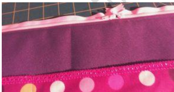
Vue zip, côté tissu extérieur près avoir rabattu la doublure et surpiqué