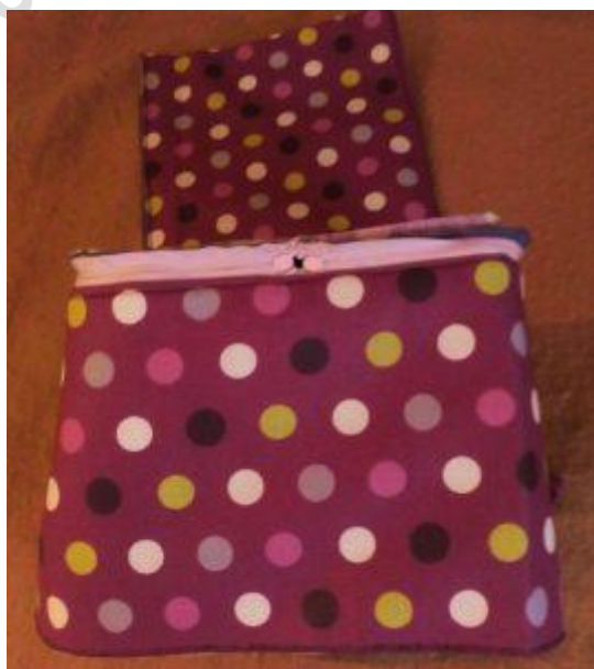
Zip posé, vue côté envers