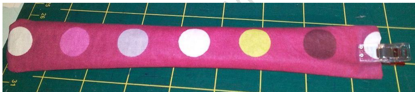
Bandes de tissu cousues et retournées sur l'endroit