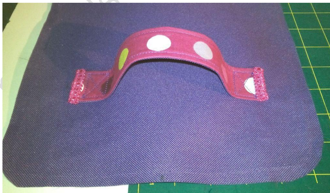
Poignée cousue sur le couvercle