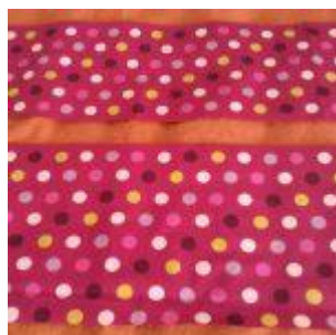
Doublure - Coton enduit