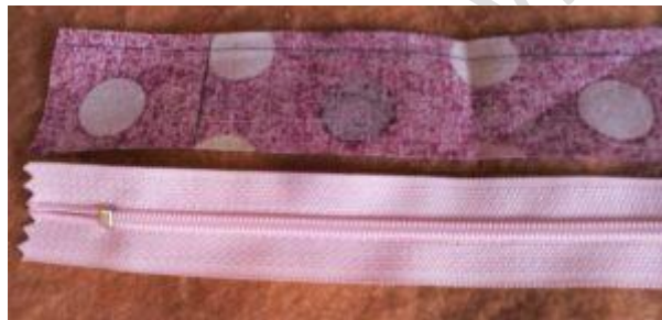
Petite bande 8 x 3 cm découpée dans la doublure à coudre à chaque extrémité du zip

3 – Fermeture éclair : Prendre le zip et coudre à environ 4 cm de chacune des deux extrémités les petites bandes de tissu de 8 cm x 3 cm. Il faut les placer endroit du tissu contre endroit du zip, coudre sur la largeur, rabattre et couper ce qui dépasse. Le trait vertical correspond à la couture à faire.