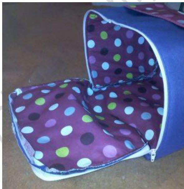
Coutures apparentes intérieures

9 - Poser un biais assorti à la doublure pour recouvrir les coutures intérieures.