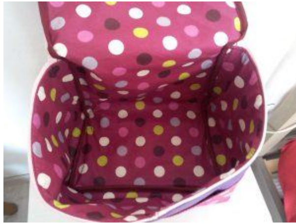
Biais posé sur les coutures intérieures

Et voilà, le tuto de la glacière vitaminée est terminé 😊